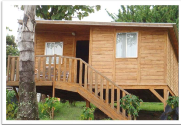
Ilustración 3 Vivienda 100% madera