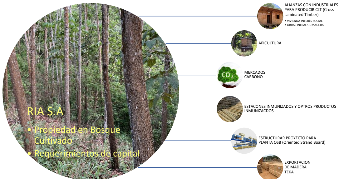
Ilustración 2 Modelos de aprovechamiento

A continuación, se muestra los diferentes modelos de aprovechamiento sobre los cuales está dirección está orientando sus esfuerzos y gestión, en procura de obtener unos mejores resultados operacionales y comerciales.