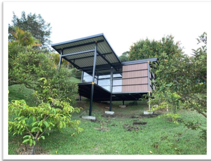
Ilustración 4 Vivienda Alma de Acero, piel de madera